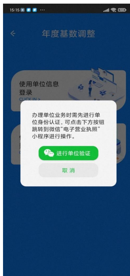
↑ 电子营业执照登录